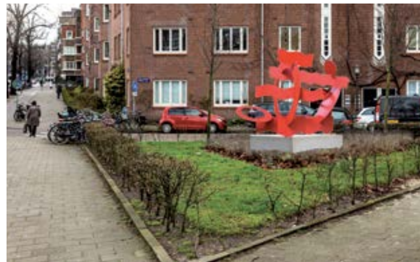
Fotomontage Rutger Emmelkamp