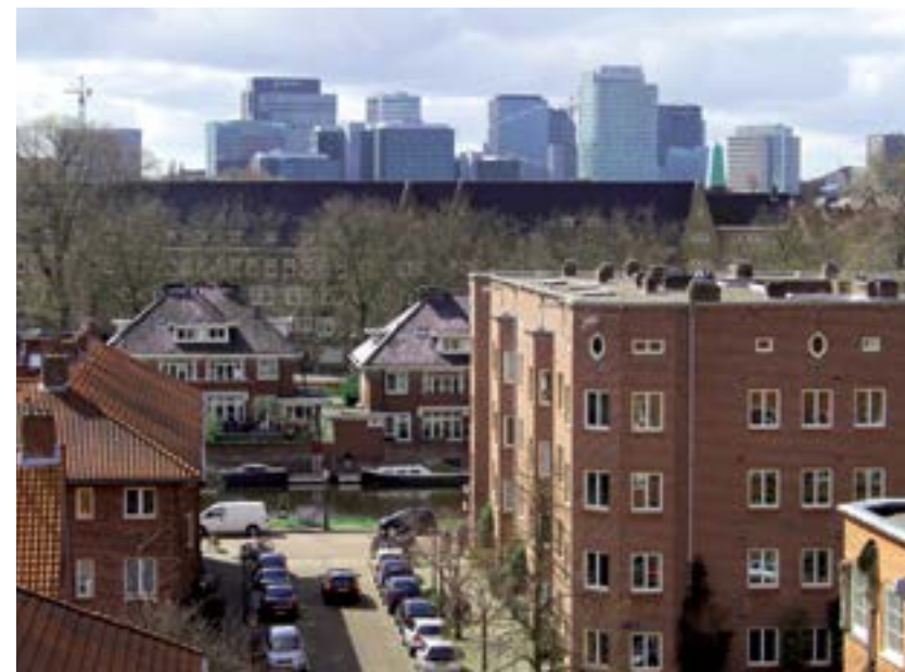
Uitzicht vanaf het dakterras.