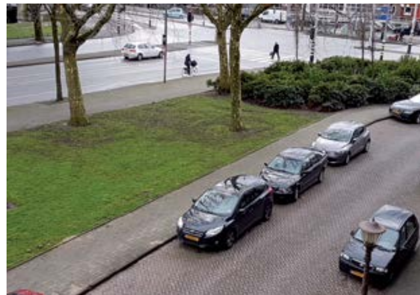
De bocht van de Hobbemakade.