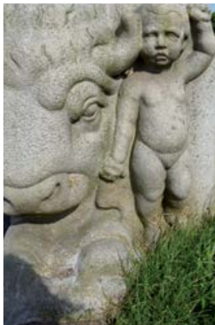
Beelden van Hildo Krop.