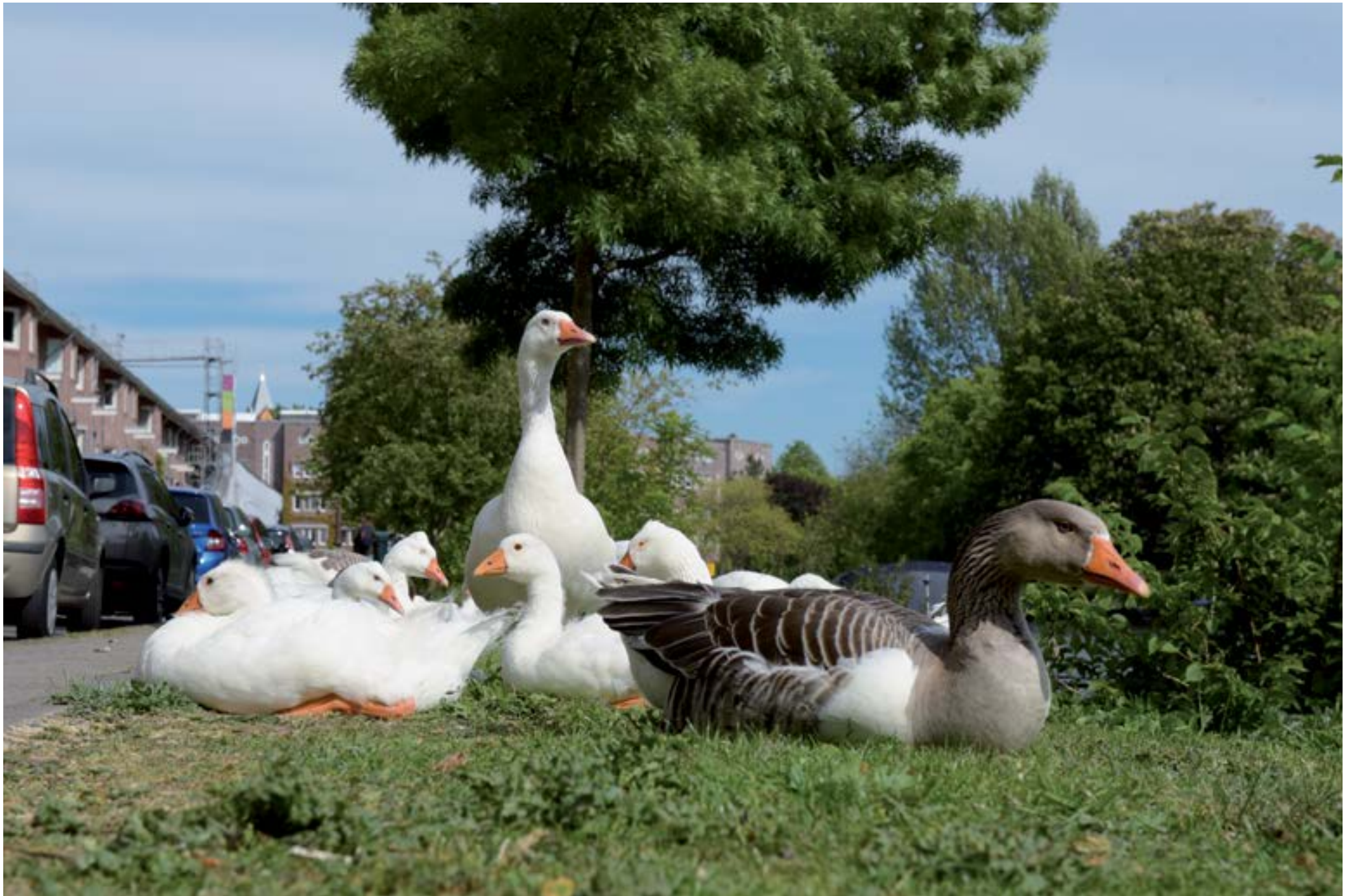
Reijnier Vinkeleskade. De bewoners zitten binnen, de ganzen hebben het rijk alleen.