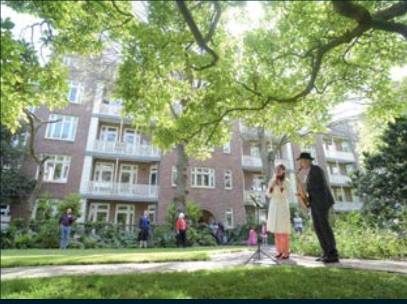
Openluchtconcert in de binnentuin en na afloop met de pet rond.