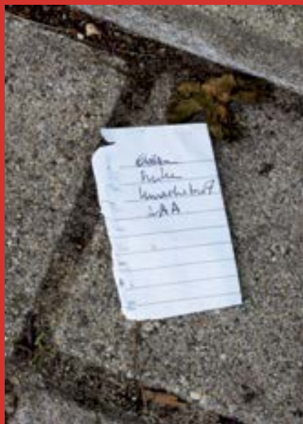
Boodschappen aan de deurknop.