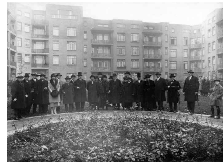
Dames en heren achter het rozenvak in de binnentuin, ca. 1925-1930

Rode en gele tulpen zijn vervangen door andere kleuren. Een mengsel van witte, roze en donkerrode tulpen is het