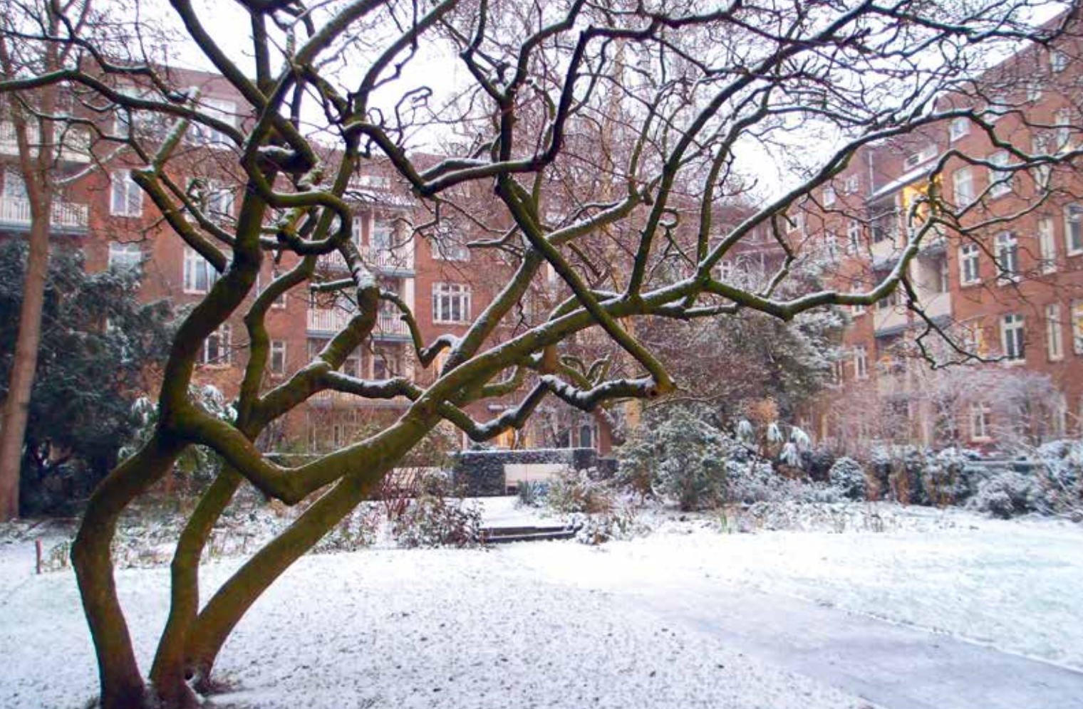
Boven: De binnentuin met sierkers in januari 2021 Midden: Vaste planten en bolgewassen onder een roodbladige Prunus in het langwerpige rozenperk Onder: De plantenbak van vorstbestendig aardewerk naar ontwerp van C.W. Brouwer; op de rand de tekst 'Heb ik het zaad hier ingeleid dan hoop ik dat het goed gedijt'