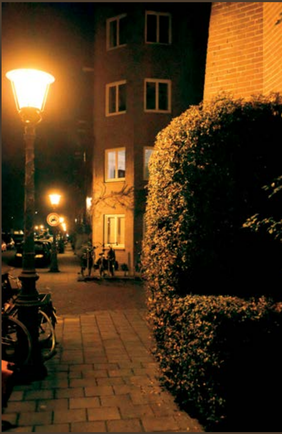
Fotoserie: Samenwerking bij nacht, Patricia Kockelkorn